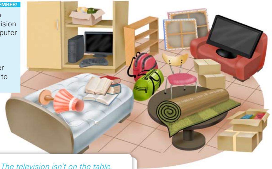
table television computer bed in on under next to near

The television isn't on the table. The television is on the sofa..